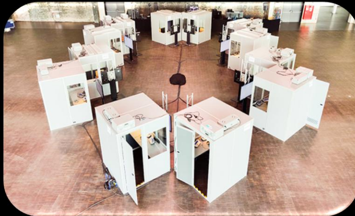
SIMULTAN-DOLMETSCHUNG INTERNATIONALE VIDEOKONFERENZ