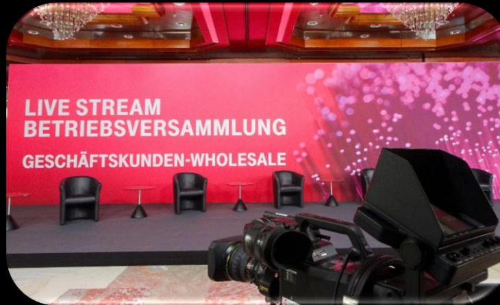
HYBRIDE BETRIEBSVERSAMMLUNG TELEKOM DEUTSCHLAND GMBH