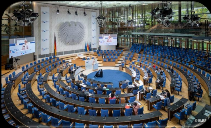
HYBRIDE KONFERENZ EU MINISTERKONFERENZ