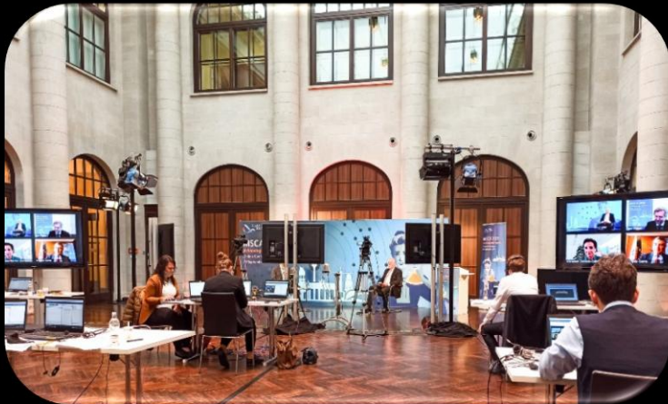
INTERNATIONALER LIVE-STREAM MSCA ONLINE-KONFERENZ